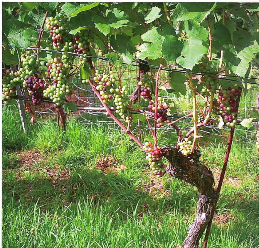
Perfekte Auslaube-Arbeit durch die Schafe.

Das Weidemanagement ist wie erwähnt ein zentrales Element der erfolgreichen Schafhaltung im Rebberg. Das Ziel des Schafprojekts ist vor allem, einen Mehrwert im ökologischen Bereich zu schaffen. Aber auch soziale und ökonomische Aspekte dürfen nicht vernachlässigt werden. Deshalb müssen alle anderen Arbeiten wie Pflanzenschutzapplikationen ohne grossen zusätzlichen Aufwand verrichtet werden können. Bis jetzt hat sich das periphere Einzäunen mit Knotengittern bewährt. Momentan wird geprüft, ob auch eine Einzäunung mit drei Elektrodrähten möglich wäre. Grundsätzlich könnte diese Variante funktionieren, jedoch ist es wichtig, dass die Schafe nicht ein zu dichtes Wollkleid tragen, da sie dann die Stromstösse nicht mehr spüren. Ein einfacher Unterstand mit einer Blachen-Abdeckung, unter der die Schafe Wasser und einen Leckstein mit Mineralsalz vorfinden, ist von Vorteil, da sie sich dadurch geborgener fühlen. Sie fühlen sich so rasch zu Hause und bleiben standorttreu. ■